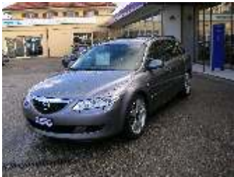
Mazda 6, 2.3 Fr. 28'800.--