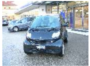
Smart Brabus Fr. 16'900.--