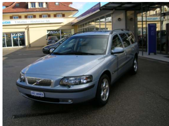
Volvo V70 AWD Fr. 27'500.--