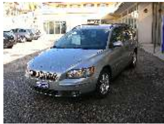
Volvo V50 2.4 Fr. 36'900.--