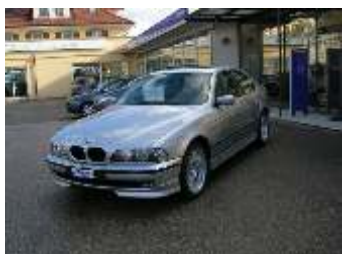
BMW 528i Fr. 19'900.--

Voici un petit choix de nos véhicules d'occasion.