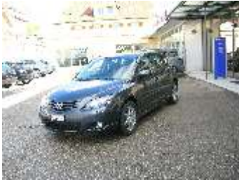
Mazda 3, 2.0 Fr. 29'800.--

NOS VOITURES D'OCCASION - VOLVO DESTOCKAGE