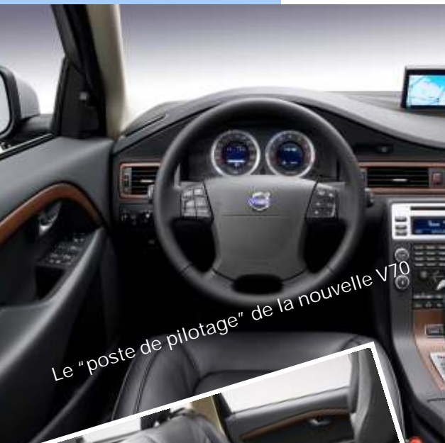
Le "poste de pilotage" de la nouvelle V70