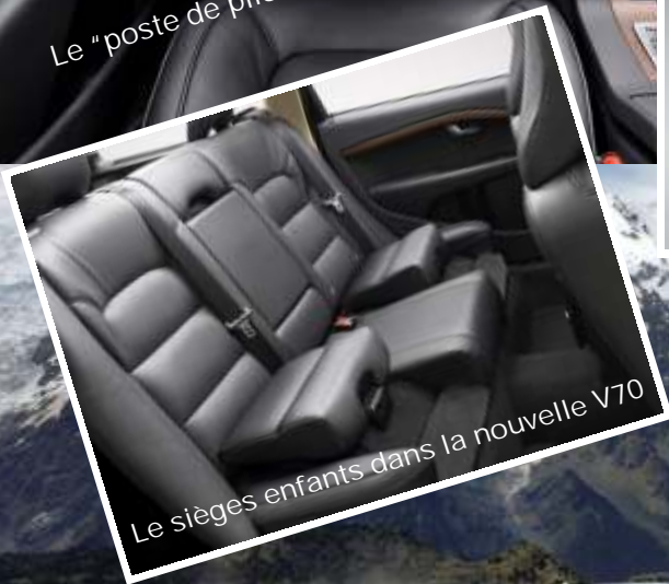
Le sièges enfants dans la nouvelle V70

Élément de sécurité de la nouvelle XC70. Cela empêche les petits véhicules de s'incaster sous la XC70 en cas d'accident frontal.