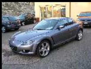
Mazda RX-8 231 Fr. 43'900.--