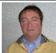
Yvan Lévy Vente occasions