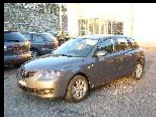
Mazda 3 1.6 Excl. 25'430.--