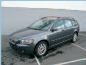
Volvo V50 T5 Momentum Fr. 40'950.--