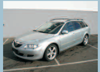
Mazda 6 2.3 AWD Sport Fr. 32'000.--