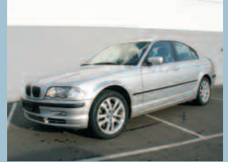
BMW 330 xi Fr. 23'900.--