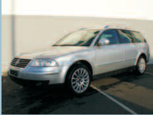
VW Passat 1.8 T Exclusive Fr. 28'900.--