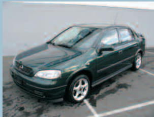
Opel Astra 1.6i Confort Fr. 8'500.--