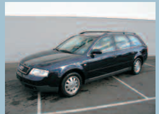
Audi A6 Avant Ambiente Fr. 24'000.--

Un choix de 150 véhicules vous attend. N'hésitez pas et demandez-nous un financement personnalisé. Un train de pneumatiques d'hiver vous sera offert à l'achat d'un de nos véhicules d'occasion. Un de nos véhicules vous intéresse? Faite-nous une proposition, nous allons l'étudier ensemble. La totalité des véhicules se trouve sur : www.autosport-mattei.ch ou www.hauterive.ch