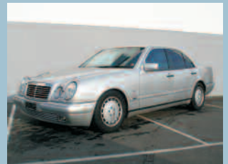
Mercedes E 240 Avantgarde Fr. 18'500.--