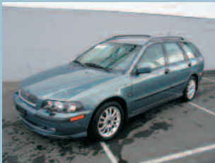
Volvo V40 2.0T Edition Fr. 28'000.--