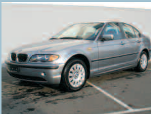
BMW 316i Fr. 29'700.--