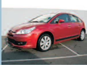
Citroën C4 2.0 Hdi Exclusive Fr. 27'900.--