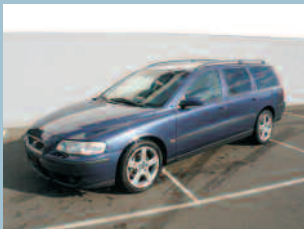
Volvo V70 R AWD Fr. 51'600.--