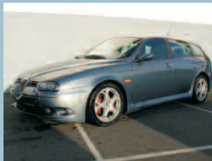
Alfa Romeo 156 3.2GTA Fr. 21'500.--